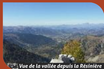
Vue de la vallée depuis la Résinière

À partir de tous ces éléments, l'implantation précise pourra être déterminée dans le 1 er trimestre 2018.