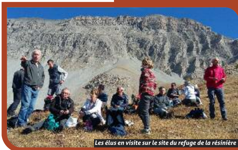
Les élus en visite sur le site du refuge de la résinière

La phase études se poursuit, notamment la partie hydrogéologique avec les autorisations et