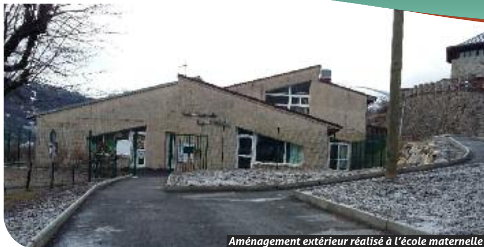
Aménagement extérieur réalisé à l'école maternelle