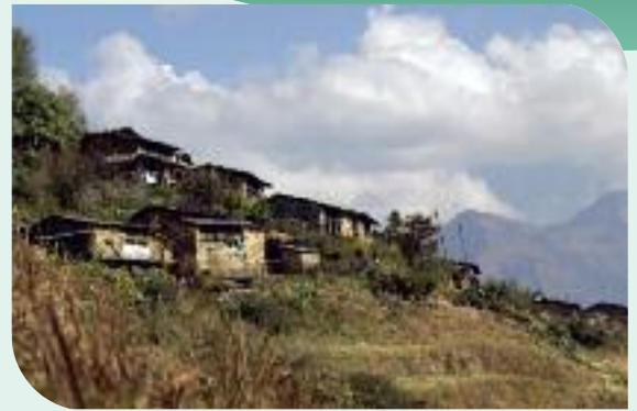
Singla avant le séisme

L'association Les Amis de Singla Provence Alpes organise une journée népalaise le samedi 25 juillet à Seyne dont le programme prévoit randonnée le matin, repas népalais animé par un groupe de musique, exposition de photos et d'articles népalais, film et expo vente d'articles sur le Népal.