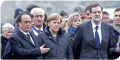
l'Edito du Maire