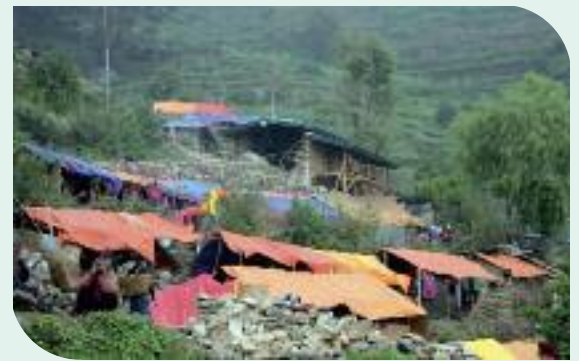
Singla après le séisme

Acte d'état civil entre le 3 décembre 2014 et le 13 juin 2015