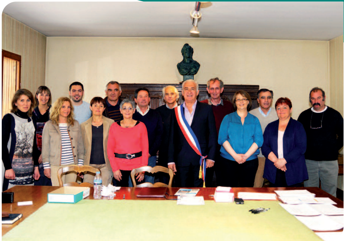
Les élus de Seyne le 29/03/2014