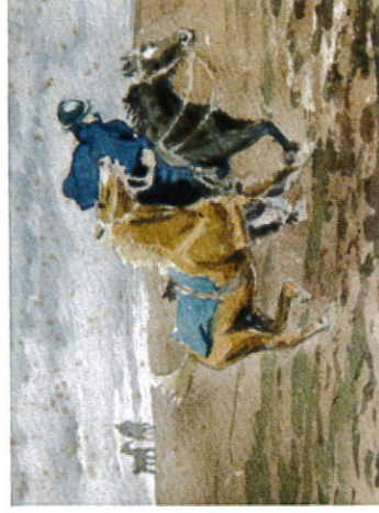
Edouard Renaud, Somme Biennale Décembre 1915, Collection du musée de Fécamp